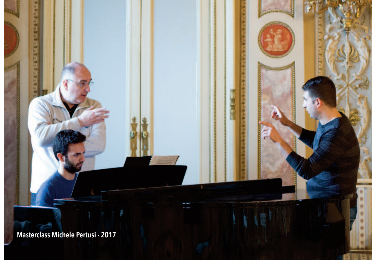
Masterclass Michele Pertusi - 2017

Il mancato rispetto dell'obbligo a sostenere i ruoli nell'ambito delle suddette produzioni e di partecipare ai corsi comporta il riconoscimento a favore dell'AsLiCo di una penale convenzionale pari al 50% dei compensi stabiliti per il periodo dei corsi e per le produzioni, salvo il maggior danno.