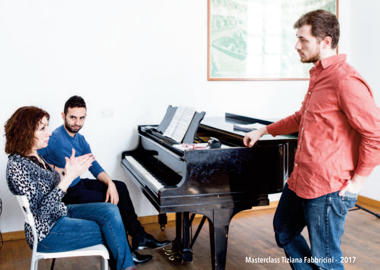
Masterclass Tiziana Fabbricini - 2017