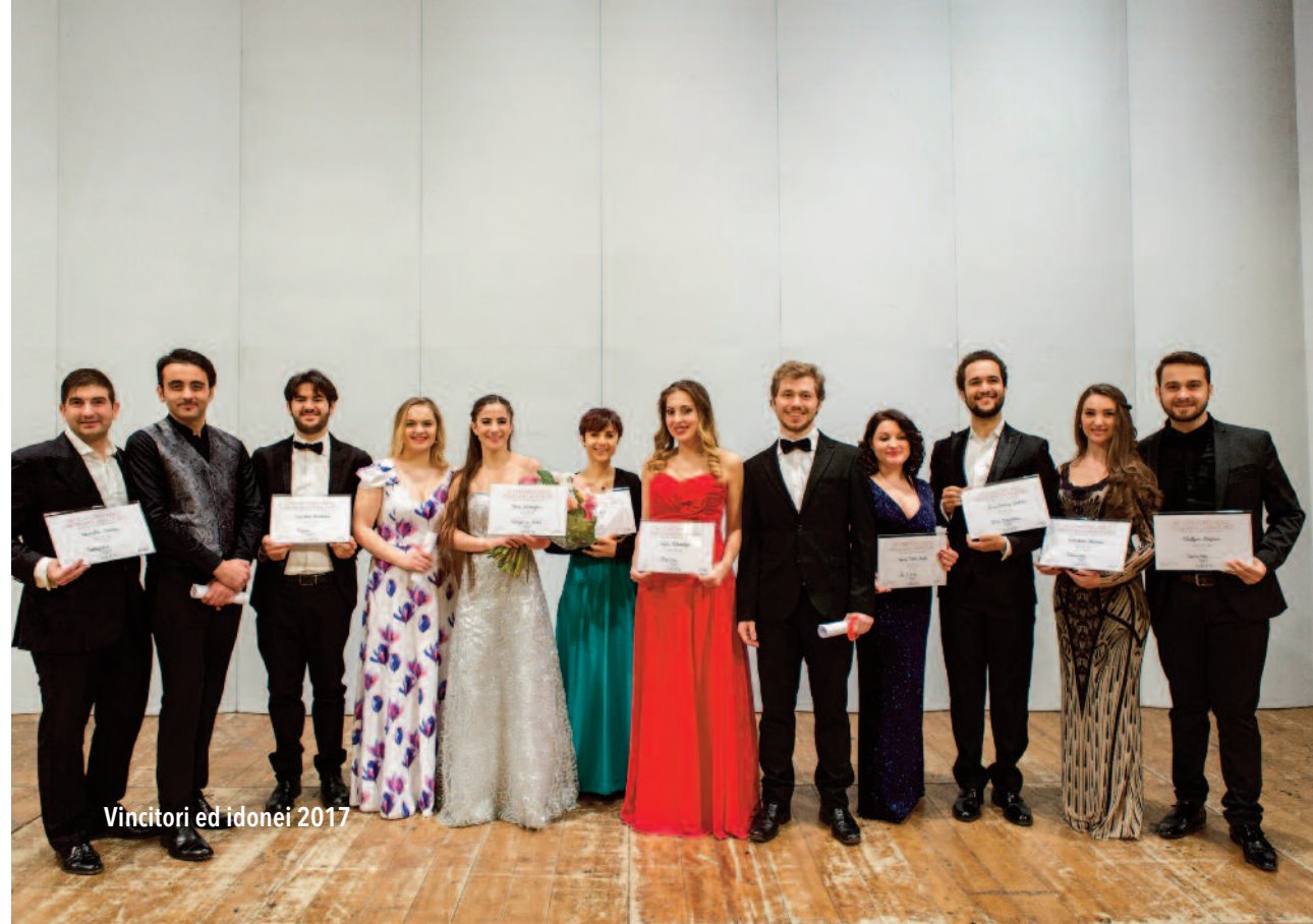
Vincitori ed idonei 2017